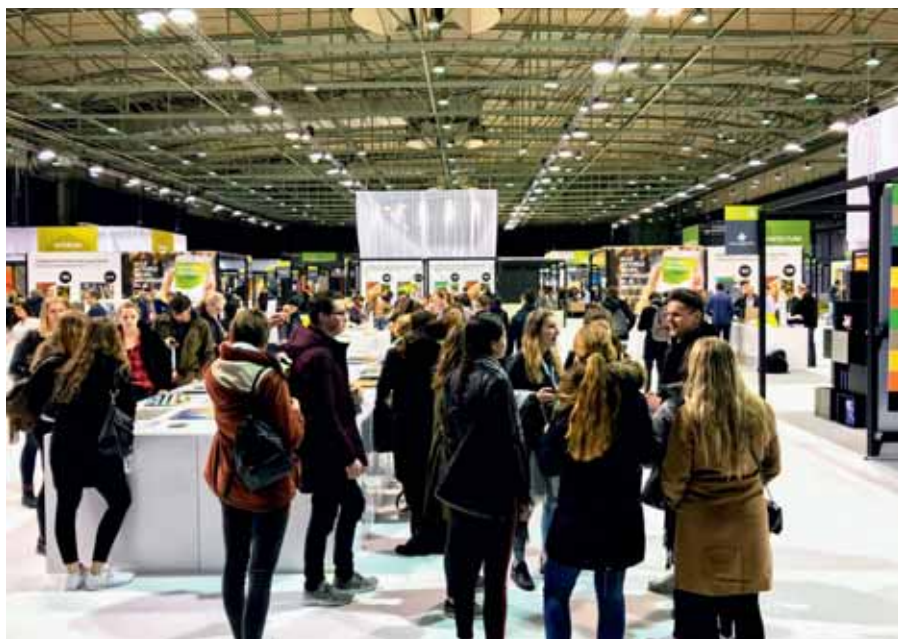
Material Xperience trok dit jaar een recordaantal bezoekers.